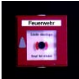
Druckknopfmelder im Gebäude

Verschiedene Ausführungen von Druckknopfmeldern aufzeigen und erklären