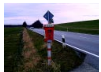
Notrufsäule an der Bundesstraße