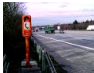
Notrufsäule an der Autobahn